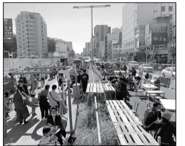
並木道公園構想がいよいよ始動 トランジットモールを提唱する一人として、歩くことを基本とした道づくりに一層力を注ぎます。