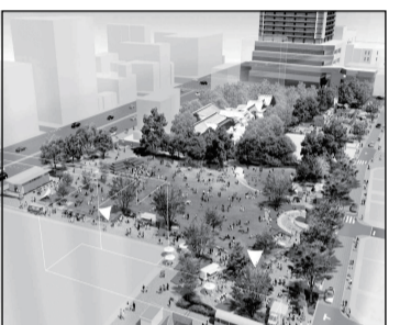
金公園整備と文化センター再整備 サードプレイスを標榜する新たな金公園に隣接する岐阜市文化センターの再整備を調整します。