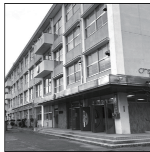
学校プール敷地を有効活用 稼働率の低い学校プールを民間委託し、不足している放課後児童クラブへ有効利用するよう提起しています

会の特集記事で、お隣の羽島市がプールの授業を段階的に民間委託していく報道がありました。政務調査を通じ私も数年前から提案している内容です。そもそも学校プールは前回の東京五輪前後に旧文部省の方針により整備されたものですが、その稼働率は年間を通じて実に低い実態があります。公共施設マネジメントが重視されるようになり、各地で民間プールへの委託などへ移行しています。岐阜県でも小学校教職員試験でのプールの実技は廃止されているので、羽島市に続き県内でも動きが出てくるものと思います。今後、段階的に廃止される際には放課後児童クラブ等のスペースへ有効活用できるように引き続き政策提起したいと思っています。