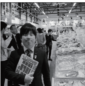
日本版コストコ的な市場！ 法改正により食のテーマパークとしての要素が加わる川越地方卸売市場の一般開放店舗（昨年行政視察）

場いっぱいには新鮮な食材が並ぶ市場まつりが定着しています。このほど卸売市場法の改正により市場開放がさらに進み、従来の卸売に加え一般消費者への小売が可能となりました。老朽化している岐阜市中央卸売市場ですが、昨年の市場開設運営協議会にて現在地での再整備方針が既に決まっています。こうした状況の変化に対応するため、川越地方卸売市場などの先進事例の研究を進めています。仲卸との同居に伴う徹底した衛生面の確保と共に効率的な動線確保などの食のテーマパーク・日本版コストコの要素を加えながら、また流通ルートの激変も見据えながら、近未来の岐阜市中央卸売市場のあり方を見出していきたいと思っています。