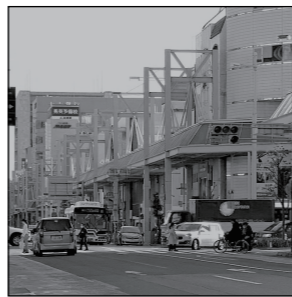
店舗リノベーションを加速 岐阜市商店街振興組合連合会、岐阜柳ヶ瀬商店街振興組合連合会の長年の要望事項が実現しました

議会は新年度予算を可決し閉会しました。一つ一つの予算が市民の皆さんの幸せに繋がることを願っています。中心市街地に関連しては、長年にわたり質問・要望してきた空き店舗への補助支援策に「初期投資支援」が拡充。いままで認められていなかった改装費（リノベーション）にも補助が受けられる要綱に改められることになりました。足掛け8年間の要望事項がようやく実りました。当局からは地権者の資産形成につながる恐れがあることを理由に否定された案件を転換した理由を尋ねると「各物件自体が老朽化しており市としてもうひとランク上の支援策へ舵を切った」とのことでした。各政策をより一層前進させられたらと思います。