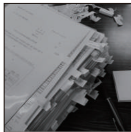
岐阜市議会・政務活動公開 下記にて全て公開されています。厳しくチェックください。 www.city.gifu.lg.jp/30491.htm