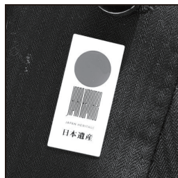
日本遺産 (japan heritage) 魅力溢れる有形無形の文化財を地域が主体となって発信！文化庁がこれを応援する仕組み。