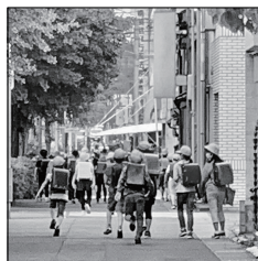
いよいよ学校が再開！ 登校日より開始、6月上旬は午前午後の分散登校、中旬より通常授業が本格始動、子どもたちはまちの宝です

夕方の下校と共に元気な子どもたちの声に戻りました。まちにはなくてはならない声であり光景です。6月中旬迄が午前・午後と地区を分けての分散登校、6月下旬から給食も再開され通常モードが再開、夏休みは8月5日から20日、運動会や文化祭など学校の代表的な学校の年中行事の殆どが中止となる予定です。子どもたちらしい学校ならではの学びの場の確保に向け知恵を絞りたいと思っています。それにしても日常がこんなに恵まれたものだったと気付かれます、との声を伺いますが、コロナからの学びもまた少なくないのではと思います。