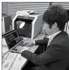
予算要望をまとめています 第一に命を守る、第二に経済を守る、第三に教育を守る、この三本を柱に予算の組み換えを要望しています

で開始している支援策と共に自民党派の予算要望についても意見集約を行っています。現金給付や現物給付など非常事態を凌ぐための緊急支援の次には、コロナとの共生を前提とした新たな経済対策、例えば緊急対策としてビニールシートで仕切られている店舗のレジ周辺や窓口周辺などの本格的な設備投資、オンラインシステムの導入支援などについて引き続き現場を伺いながら意見要望、調整していけたらと思います。