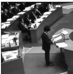
公共施設等総合管理計画 ハコモノ+インフラ全ての 公共施設老朽化対策に着手

◆市民病院の経営のあり方 市 市民病院の新病院改 革プランが公表さ れ1年が経過し、 検討経過について本会議質問 県策定の地域医療構想に基づ く地域包括ケアシステム構築 断らない救急体制構築、岐阜 医療圏ネットワーク化、経営 形態の見直し議論が進んでい ます。今回の市民病院院長答弁 では、経営のあり方を見直し ていく方針が明確に示されま した。独法化等自由度の高い 経営の長期構想が始動します。