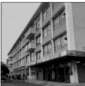
早稲田大橋本副総長が視察 旧徹明小跡地活用について 産学官+地域との協議着手